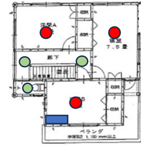
残置物 ■ エアコン ● 照明器具 設備 ● 照明器具