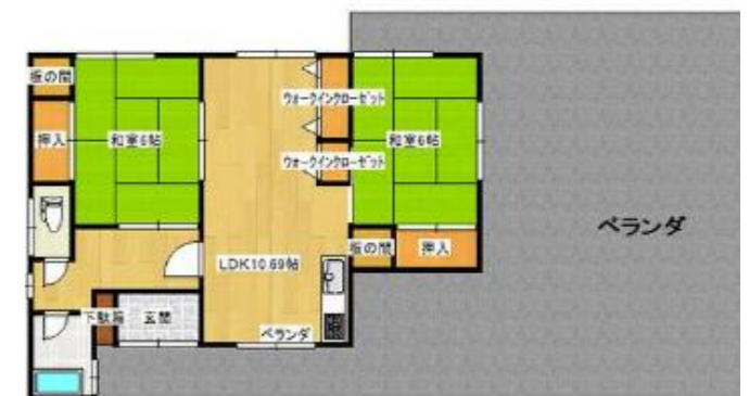
この物件は建物の2階部分です