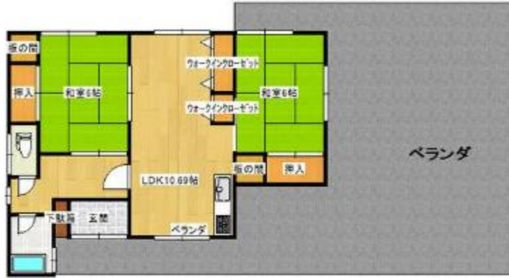
広めのバルコニーに室外倉庫まで有る、閑静な住宅地の物件です。