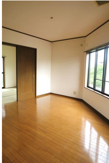
① LDK 11.75帖