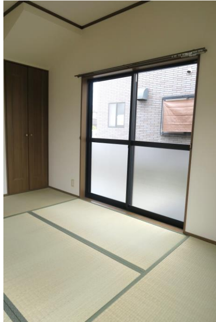
② 和室 6帖