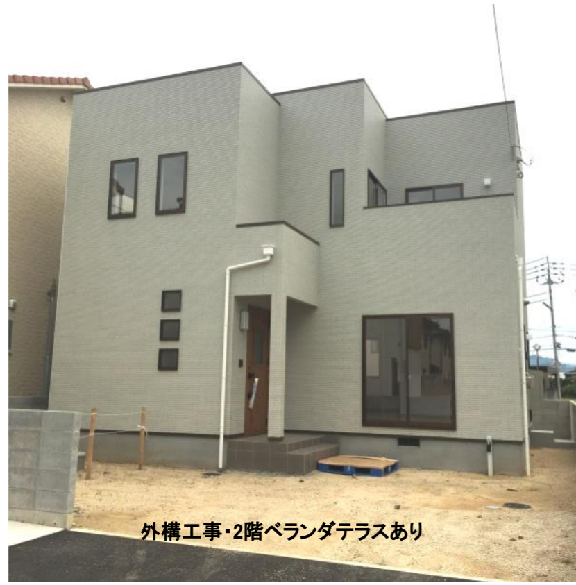
外構工事・2階ベランダテラスあり